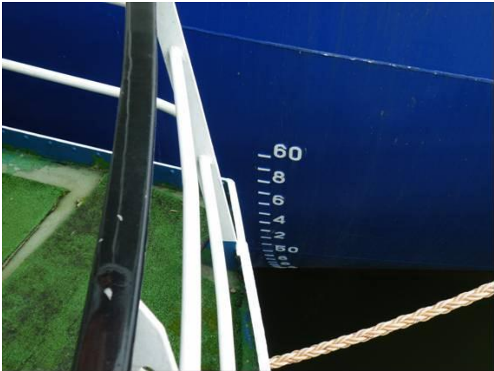
Dybgang fuld lastet 5,6 meter