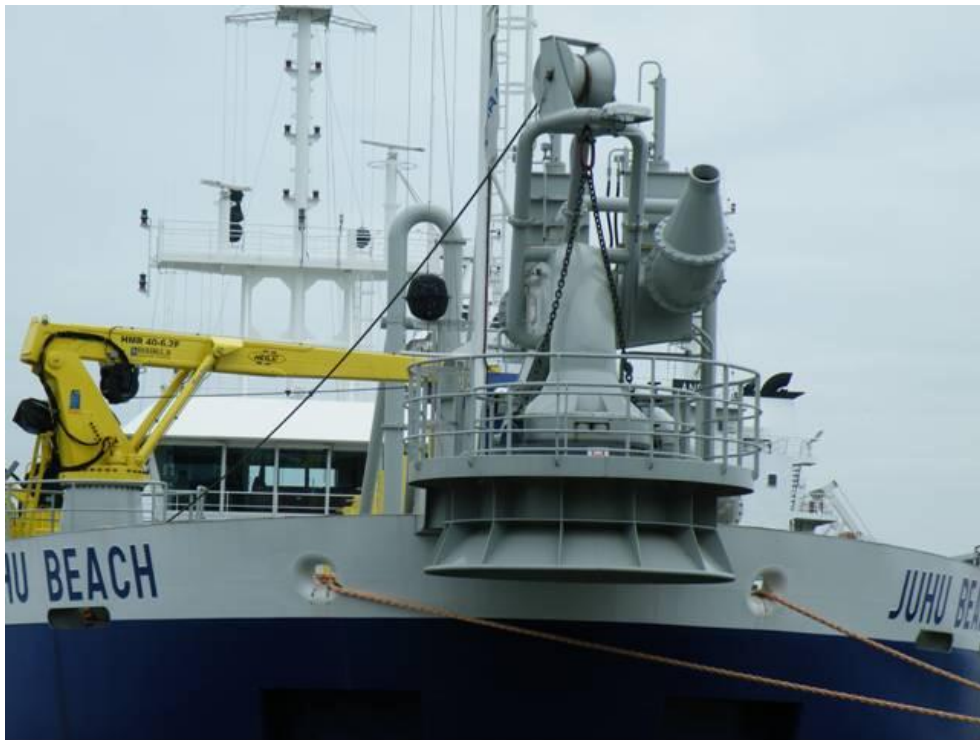
Vi ser her faciliteterne for rainbowing og koblingen for flydeledning.