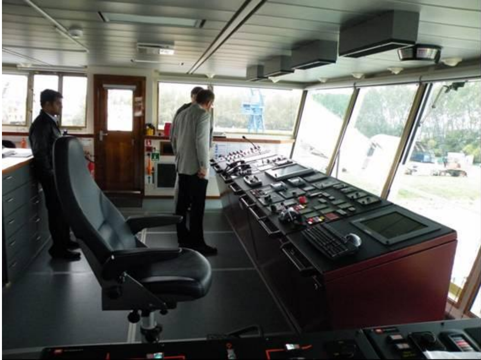
Her ser vi navigatørens arbejdsplads