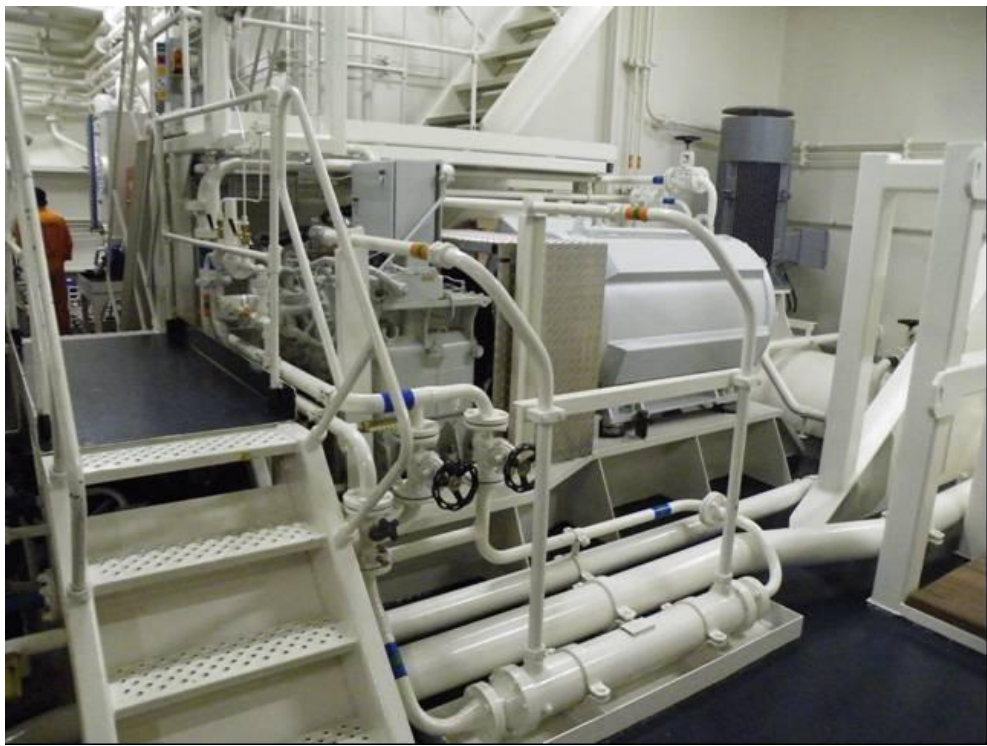
EL motor for hovedpumpe.