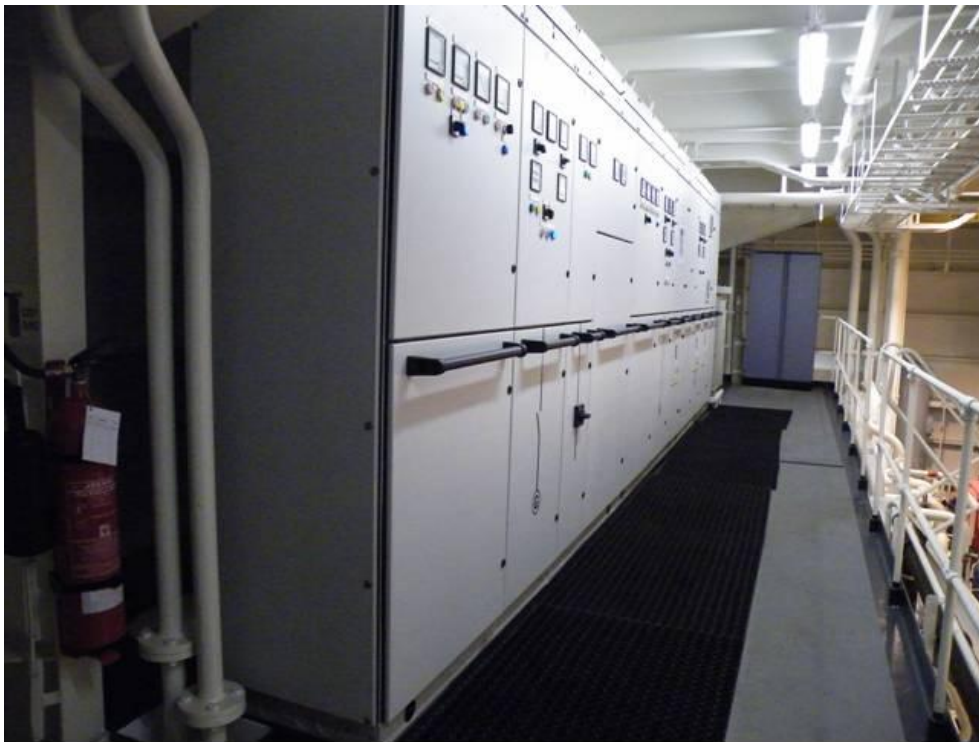
Alle pumper og fremdrift er baseret på elektromotorer, som styres via denne store EL tavle