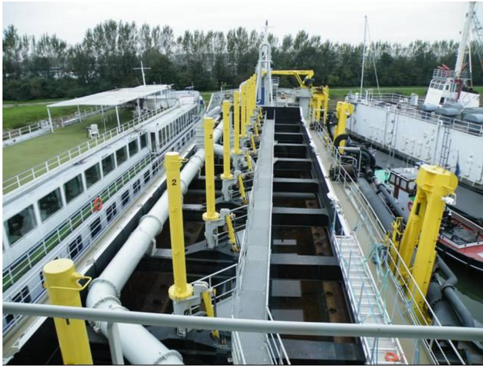
Vi ser her faciliteterne for bundlemene