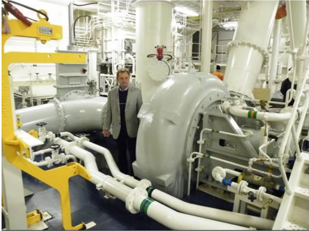
Her ser vi hovedpumpen IHC HRLD 123-30-70