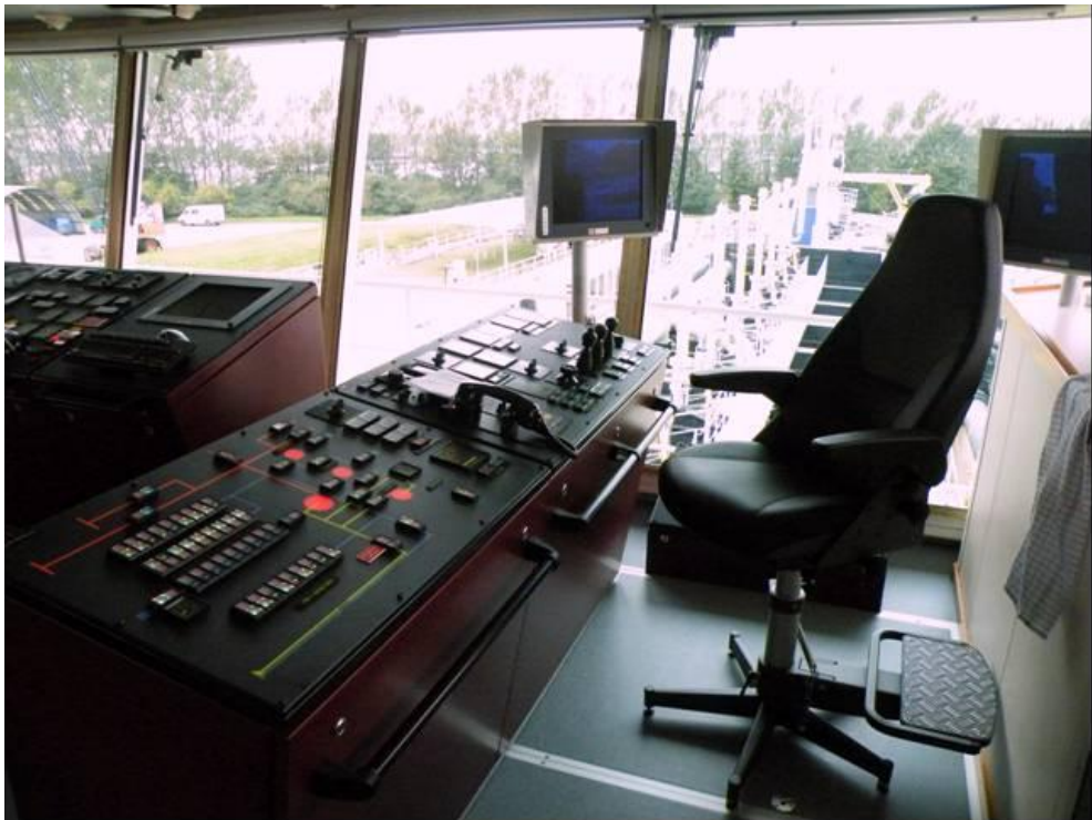
Her ser vi operatørens arbejdsplads hvorfra alle pumper og lemme styres Skibet kan således opereres af 2 mand og en kok.