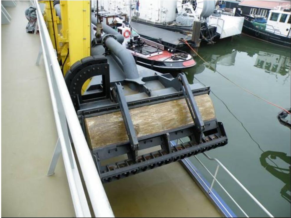
IHC sugehoved med water injection