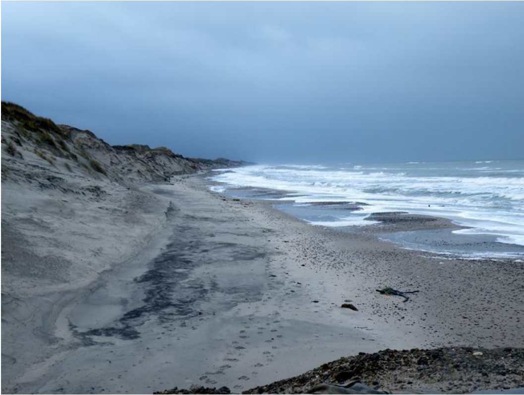
Fellen mod syd d. 7 januar 2014