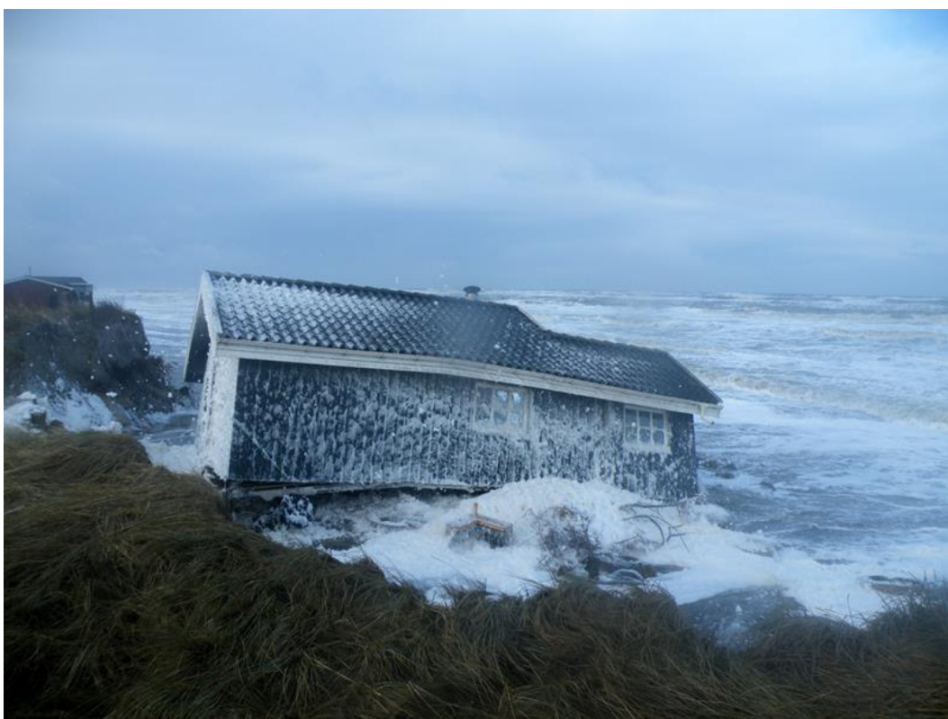
Den 11 januar 2014 ligger dette hus på Nørlev Strand ude i havet