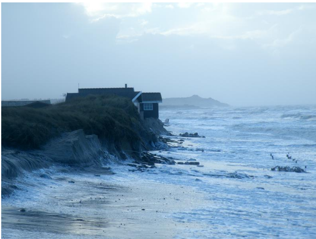
Sandet skyller i havet d. 9/10 januar 2014