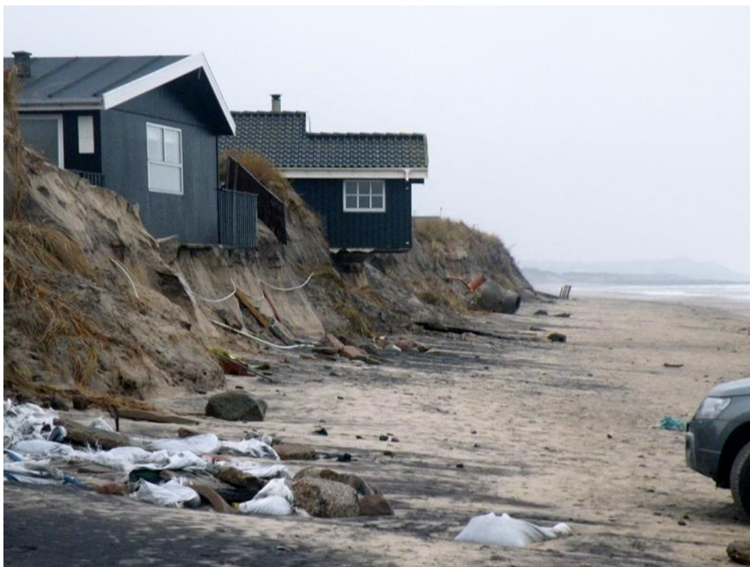
Nørlev Strand d. 4 januar 2014