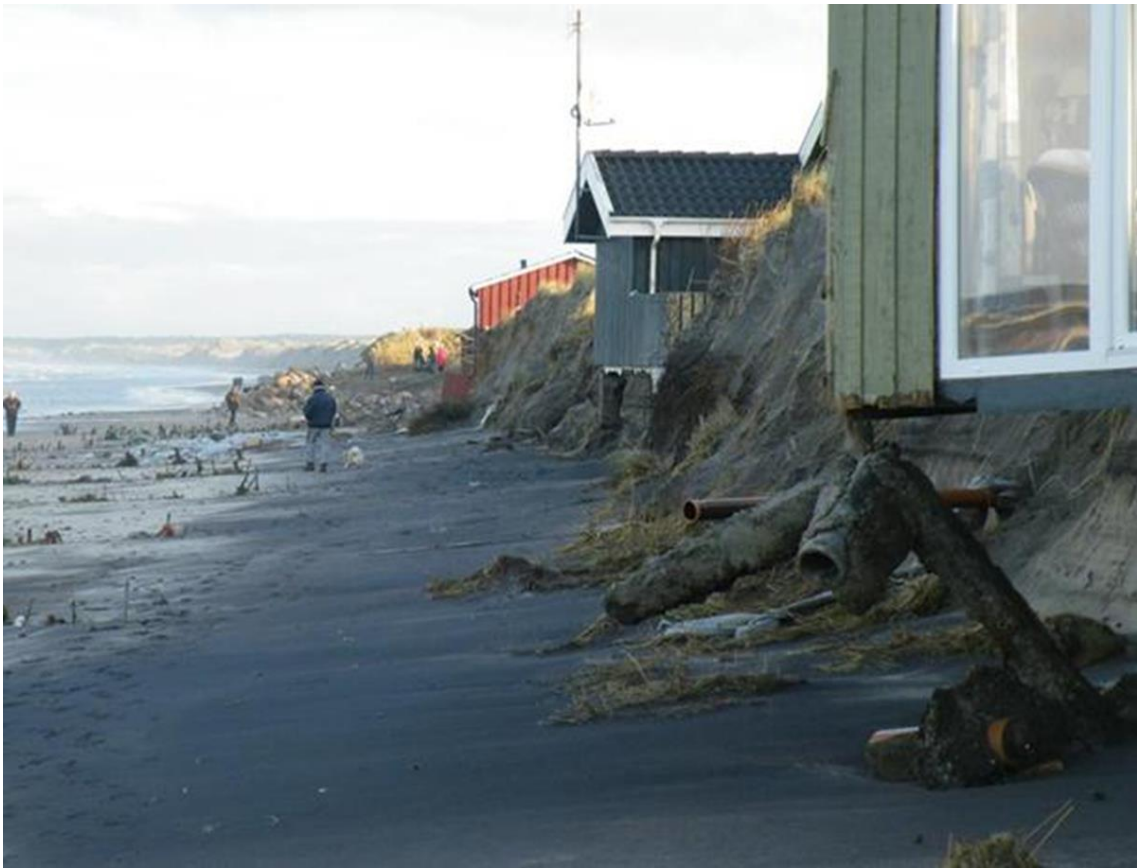
Da trykudligningsmodulerne var fjernet fortsatte erosionen og klitterne forvandt