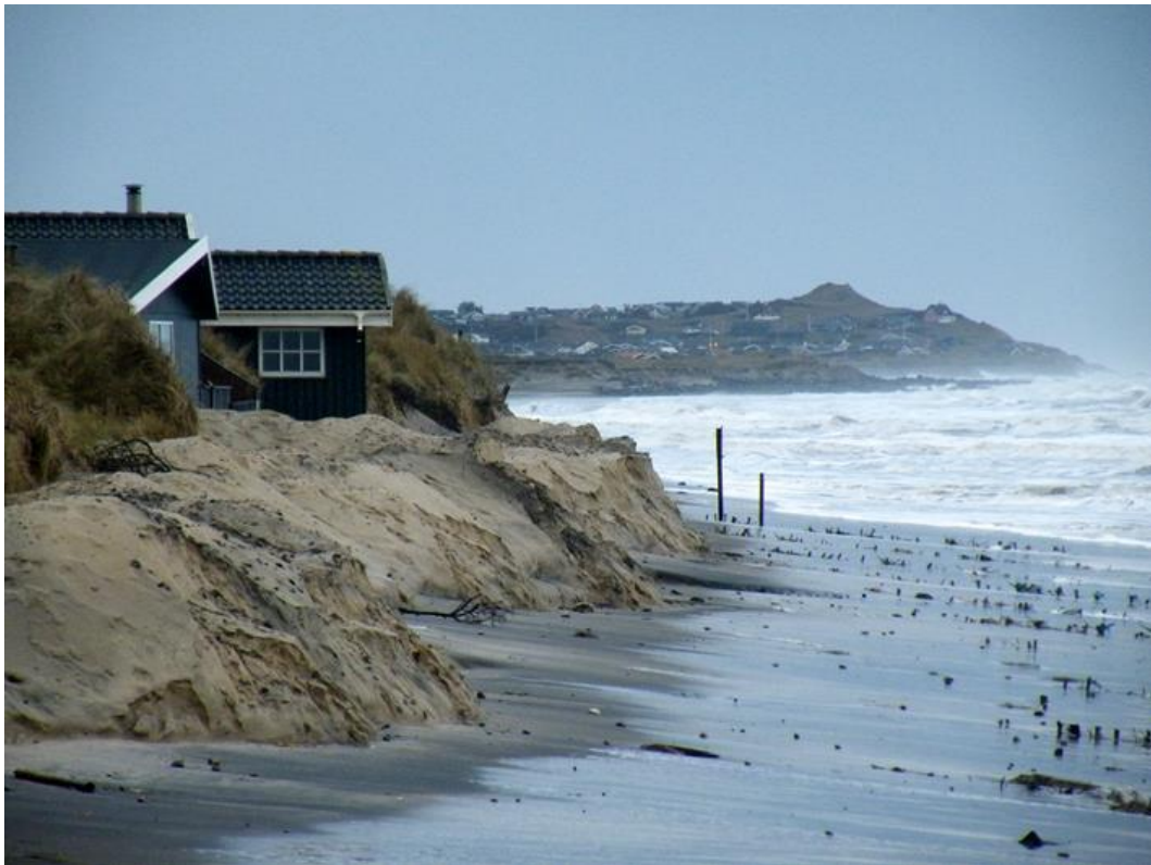
Nørlev strand 11 december 2014