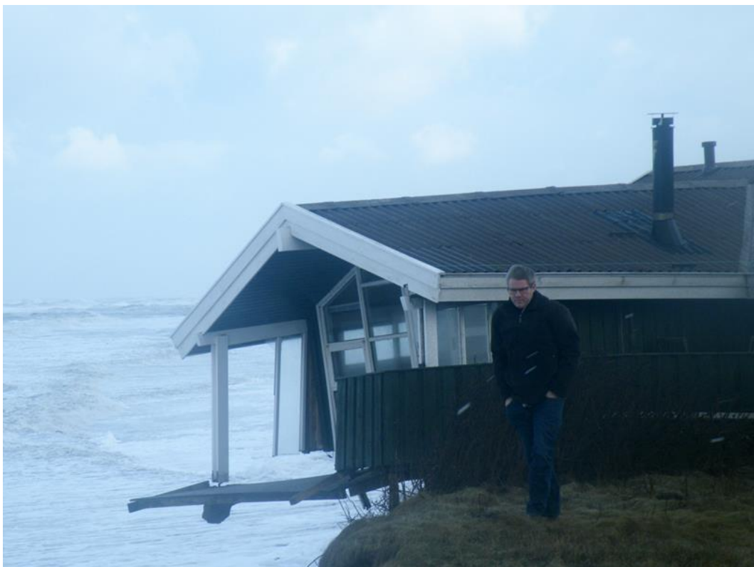
Natten mellem d. 10 og 11 januar 2014 tog havet så 11 meter af skrænten og husene er totalt ødelagt Husene Morgenvej 2 , 4 og 6 kan nu køres væk som skrot