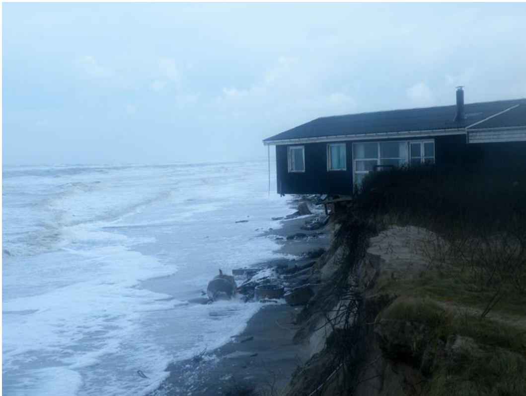
Morgenvej 6 d. 11 januar 2014