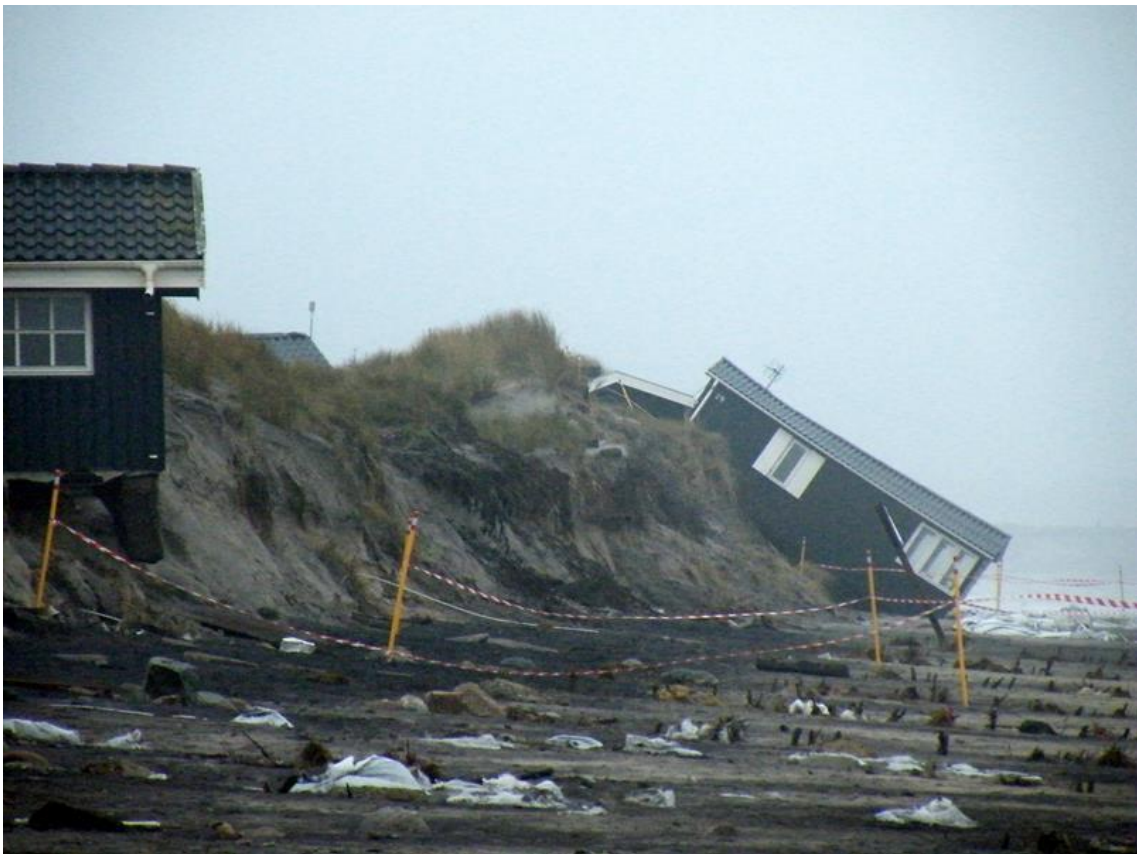
Stormen Bodil i 2013 skyllede 1 hus i havet