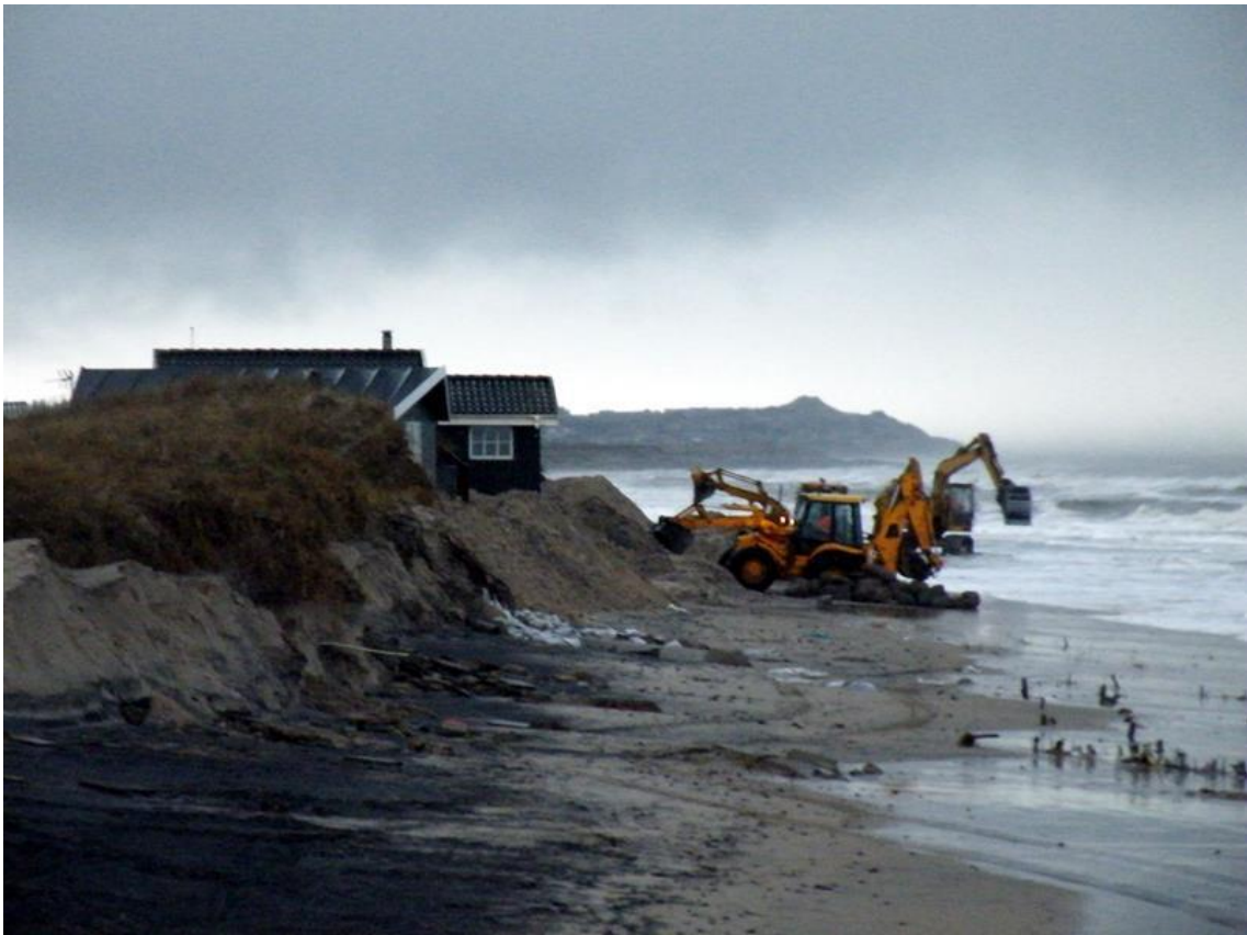
Her sandfodrer man igen d. 7 og 8 januar 2014