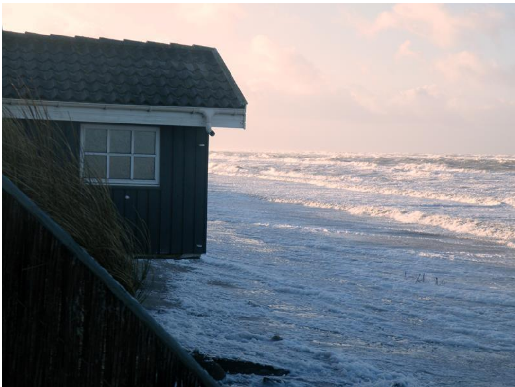
Nørlev strand d. 3 januar 2014. Havet er nu 3 – 4 meter inde under huset

Sandfodringen havde en levetid på ca. 1 time, hvorefter havet fortsatte ind under husene på Nørlev Strand