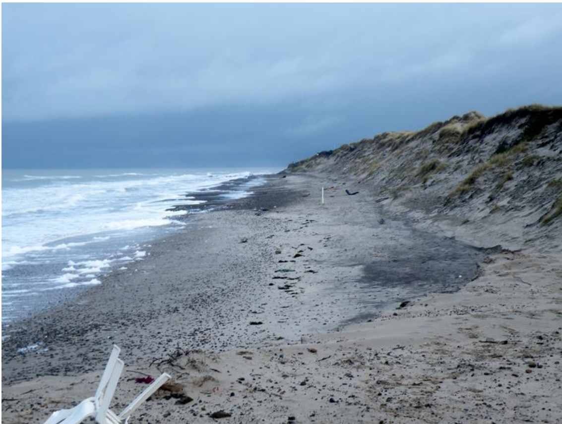
Fellen mod nord d. 7 januar 2014