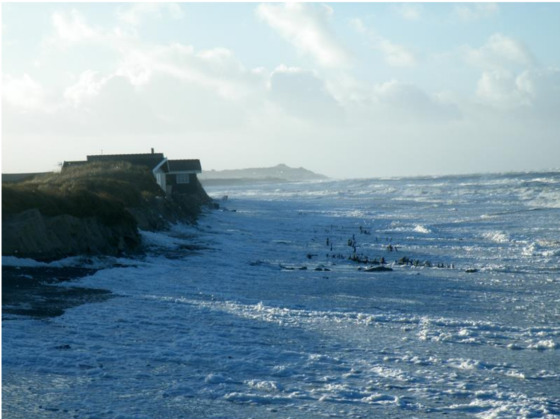
Nørlev strand 3 januar 2015 Sandet skyllede i havet på ca. 1 time