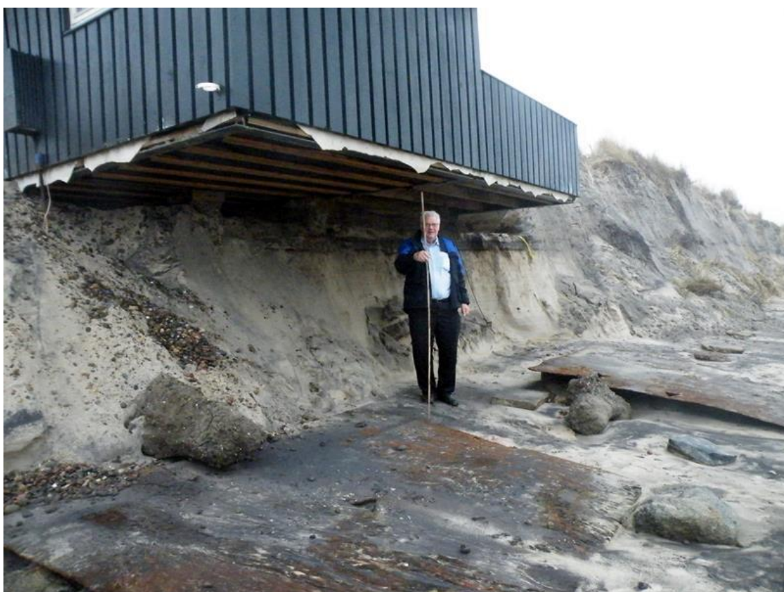
Man kunne gå inde under husene d. 4 januar 2014