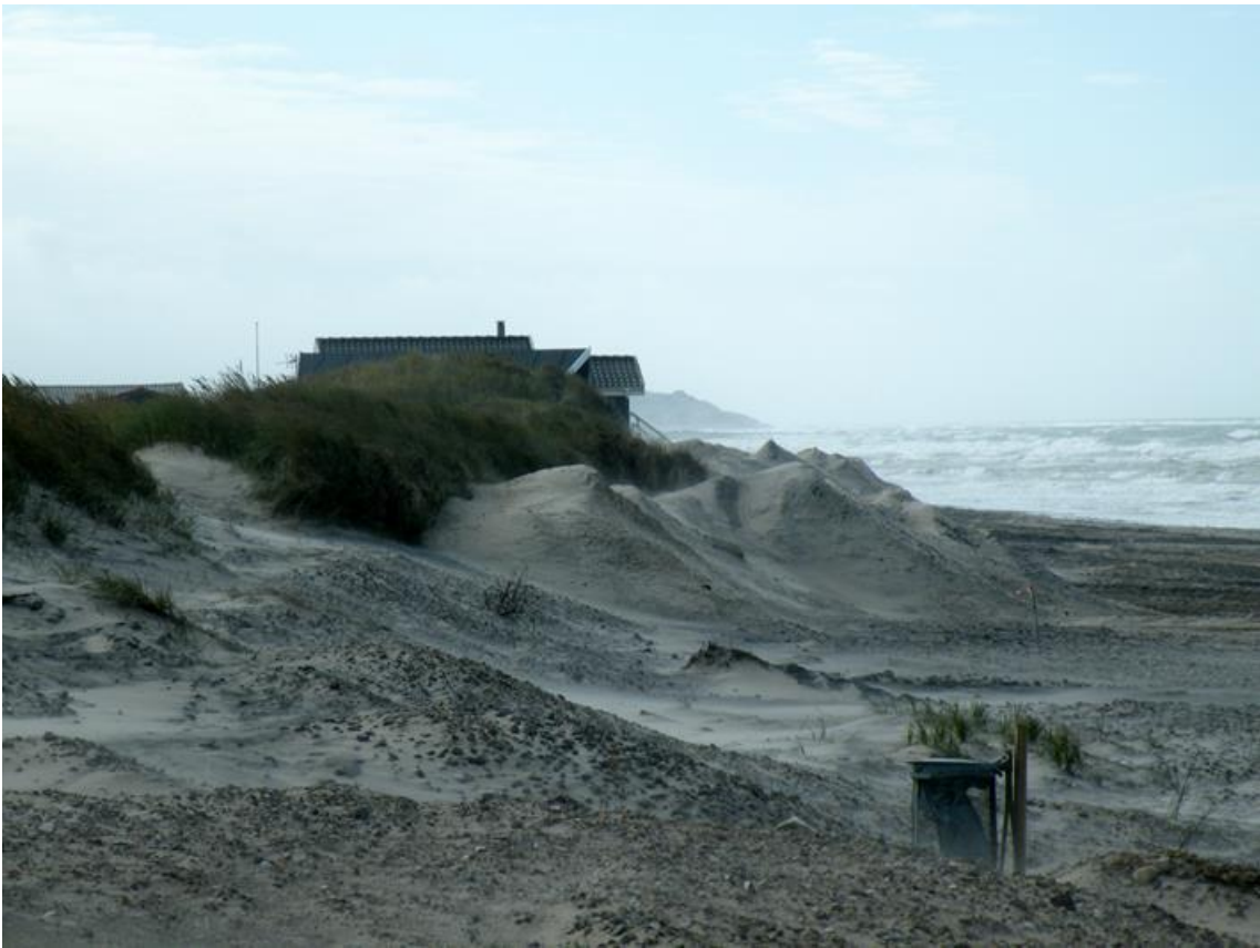
Herefter gik grundejerne i gang med sandfodring, som anbefalet af Kystdirektoratet. Billede 11 december 2014