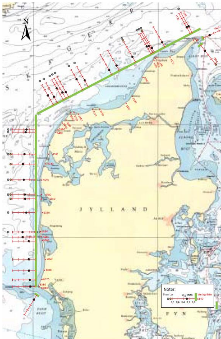
Middeldiameteren D_{50} for sand langs Vestkysten